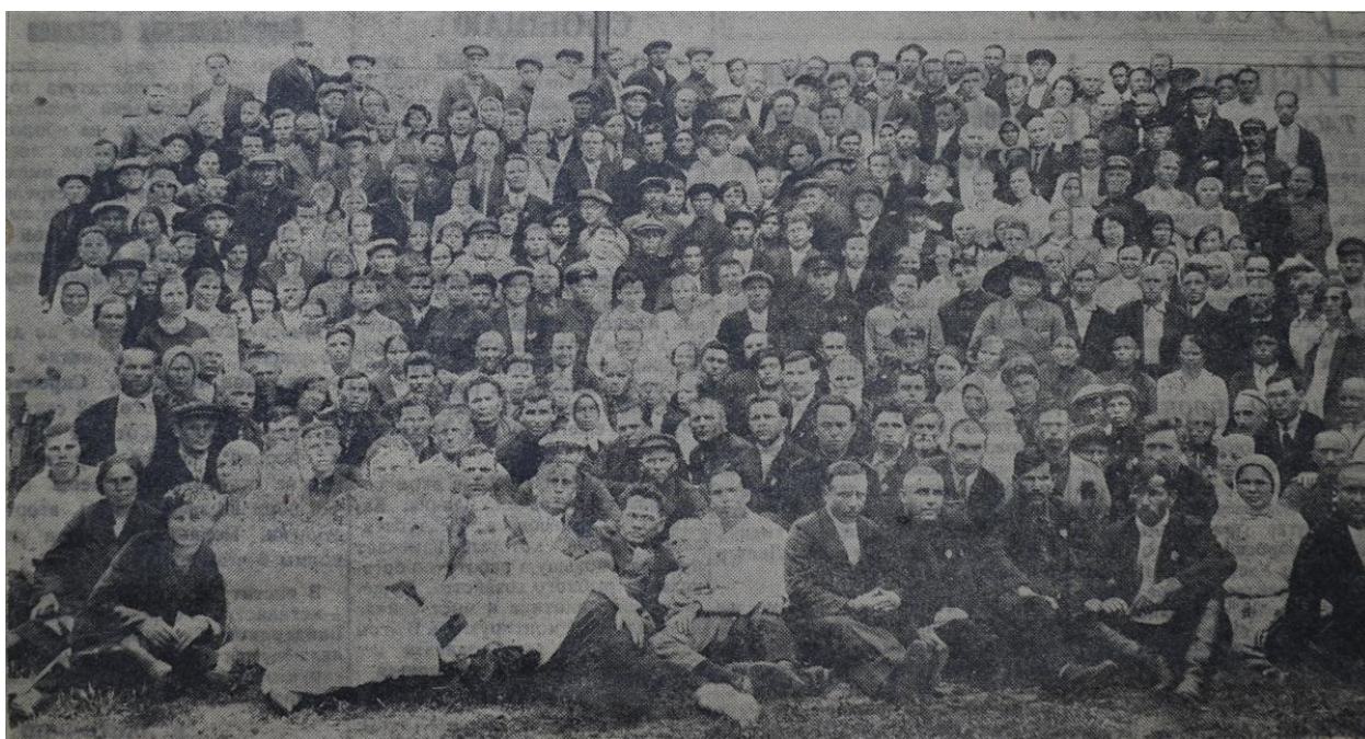
Делегаты Чрезвычайного XI Съезда Советов Марийской АССР, утвердившего Конституцию нашей республики. (Марийская правда. 1937. – 24 июня. – С. 3.)