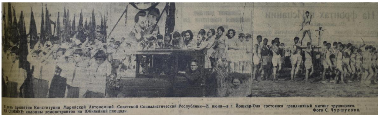
День принятия Конституции Марийской Автономной Советской Социалистической Республики—21 июня—в г. Йошкар-Ола состоялся грандиозный митинг трудящихся. НА СНИМКЕ: колонны демонстрантов на Юбилейной площади.