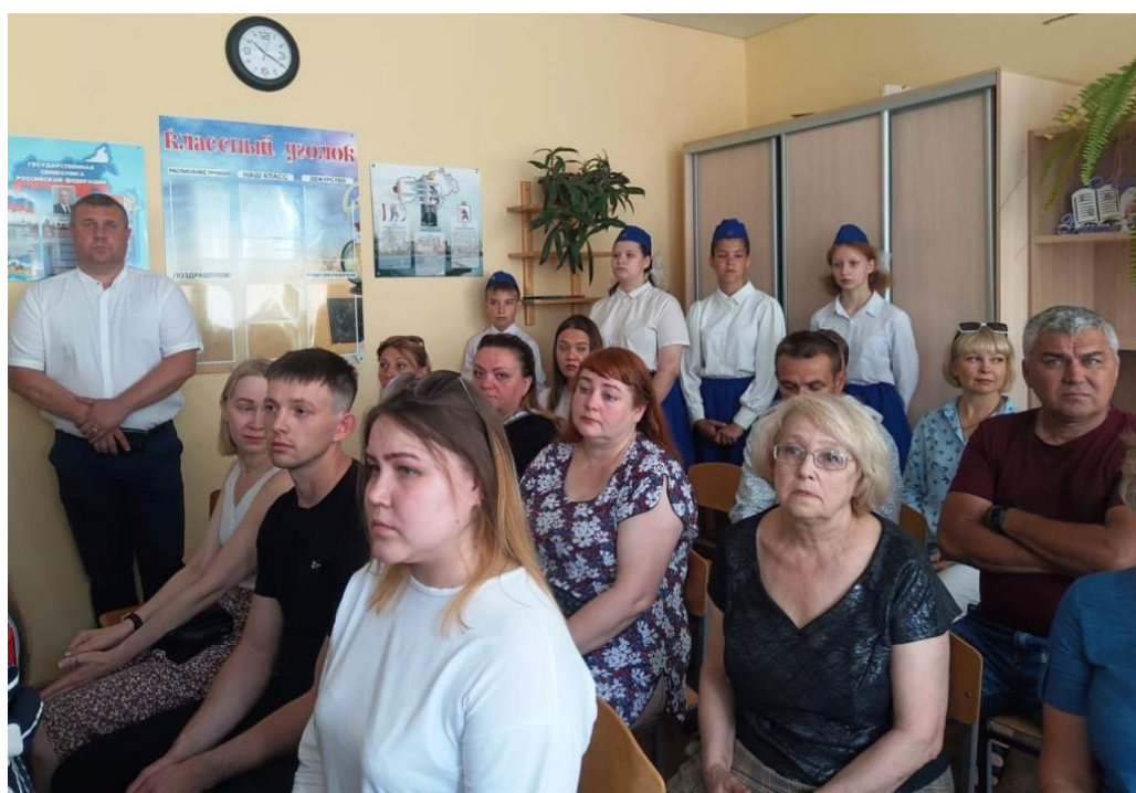
Открытие «Парты героя»